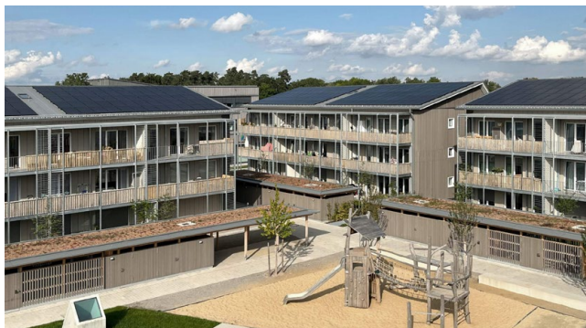
Wohnanlage in Fürstentfeldbruck/Architektur: Götze Hadlich und Popp Streib Architekten, München