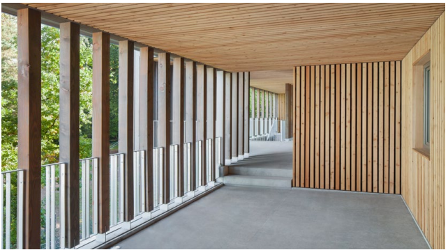
Wohnanlage in Nürnberg/Architektur: Köppen Rumetsch Architekten, Nürnberg

Gefördert werden kommunale Gebäude wie Verwaltungsgebäude sowie soziale Infrastruktur wie Schulen und Kindergärten. Ebenso werden Neubau, Erweiterung und Aufstockung mehrgeschossiger Wohngebäude gefördert. Davon sollen Städte und Gemeinden, aber auch Privatleute und Unternehmen profitieren.